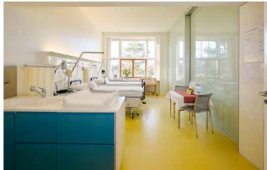
Viel Platz für die Privatsphäre: Zweibettzimmer

Die Schwangeren- und Wochenbettabteilung umfasst Einzel- und Zweierzimmer. Jedes Zimmer verfügt über ein Bad mit Dusche und WC sowie einen Aufenthaltsraum, in dem Sie sich auch einmal zurückziehen können. Im 2. Stock liegt die Neugeborenenabteilung (Neonatalogie) des Universitäts-Kinderspitals beider Basel (UKBB) für Frühgeborene oder kranke Neugeborene. Sollten Sie als Nicht-Privatversicherte ein Einzelzimmer wünschen, ist das mittels eines Upgrades Ihrer Versicherung oder gegen Aufpreis bei Verfügbarkeit möglich – informieren Sie sich dafür am besten bei Ihrer Krankenkasse sowie bei unserem Aufnahmebüro Geburt unter der Telefonnummer +41 61 265 91 91.