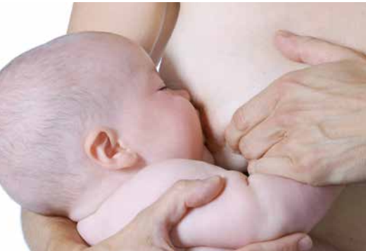
Das Stillen hat für Mutter und Kind viele gesundheitliche Vorteile.

In den ersten Tagen nach der Geburt wird Ihr Kind von einer Kinderärztin oder einem Kinderarzt der Neonatologie des Universitäts-Kinderspitals beider Basel (UKBB) untersucht. Dabei werden auch Ihre Fragen gerne beantwortet. Es ist immer eine Kinderärztin oder ein Kinderarzt im Haus – so kann Ihr Baby bei Problemen jederzeit umgehend untersucht werden. Sobald Sie wieder zu Hause sind, übernimmt Ihre persönliche Kinderärztin oder Ihr persönlicher Kinderarzt die weiteren Untersuchungen Ihres Kindes.