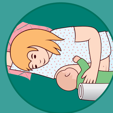
Stillen im Liegen