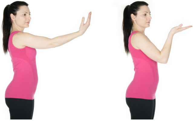
Ellbogen strecken und beugen