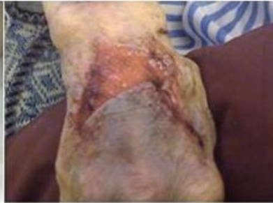
Typ 2: Teilverlust des Hautlappens

Die Haut reicht nicht mehr aus, um das Wundbett zu bedecken.