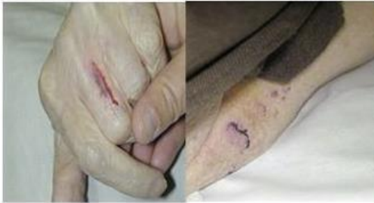
Typ 1: Kein Hautverlust

Linearer oder aufklaffender Hauteinriss *, wobei die abgelöste Haut über dem Wundbett liegt bzw. über dieses gelegt werden kann.