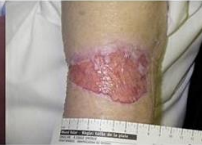
Typ 3: Totaler Verlust des Hautlappens

Die Haut reicht nicht mehr aus, um das Wundbett zu bedecken.