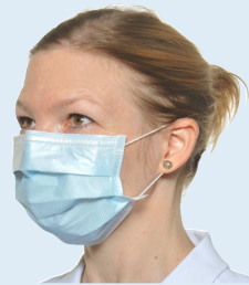
Mund-Nasen-Schutz (Typ II/IIR)