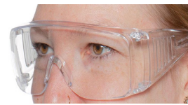
Schutzbrille (SUVA, mit Seitenschutz)