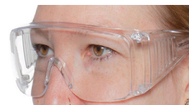
Schutzbrille (SUVA, mit Seitenschutz)