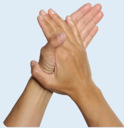
Händedesinfektion Sterillium® pure