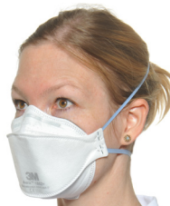
Wechsel zu FFP2 (Fit-Check)

Zusätzlich bei Aerosol-generierenden Massnahmen und Tätigkeiten mit engem/längerem Kontakt zu den Atemwegen sowie gemäss individuellem Schutzbedürfnis