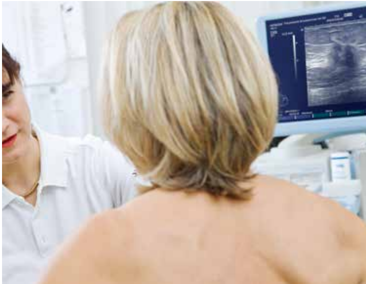
Für die Diagnose nimmt sich das Team des Brustzentrums viel Zeit und bleibt während der gesamten Behandlungsdauer in stetigem Dialog mit der Patientin.