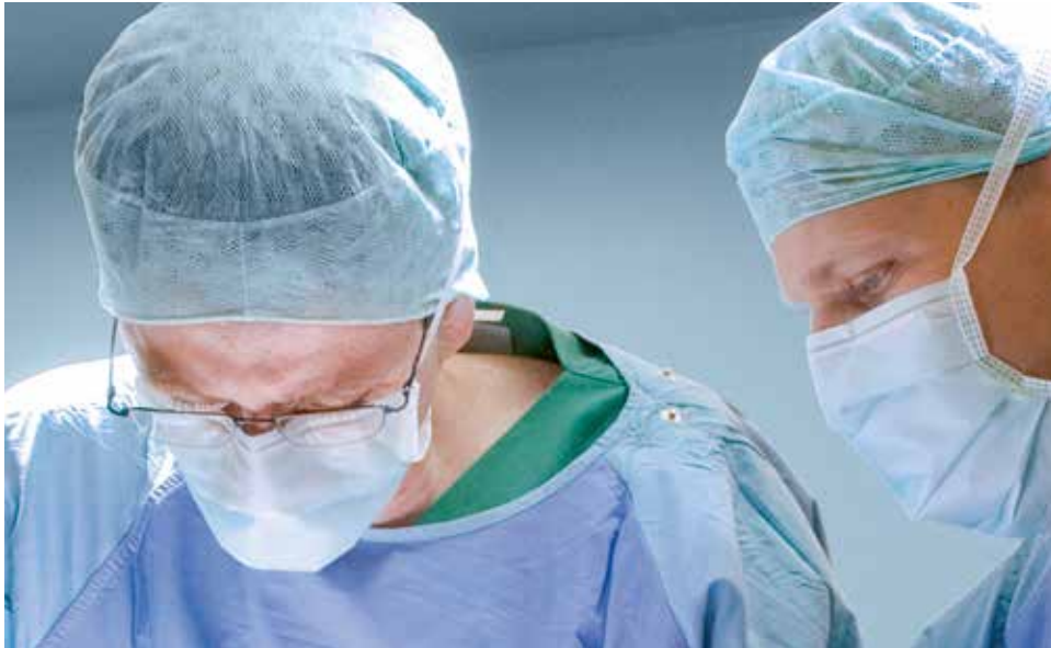
Die Operation ist für die meisten Brustkrebspatientinnen ein wichtiger Teil ihrer Behandlung.