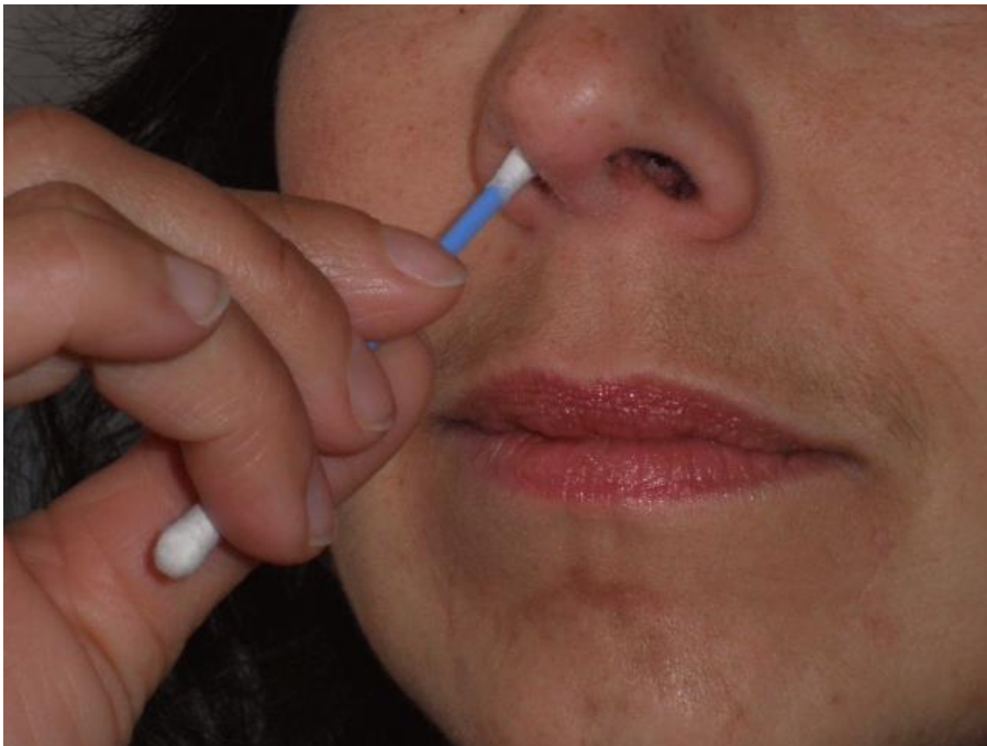
Abb. 2 Einführen Wattestäbchen nacheinander in beide Nasenlöcher

Nach der Applikation soll das Einmal-Wattestäbchen entsprechend entsorgt werden, um ein Verschleppen der Keime und eine Reinfektion zu verhindern.