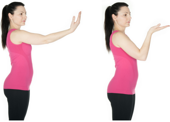
Ellbogen strecken und beugen