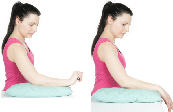
Faust und Finger spreizen