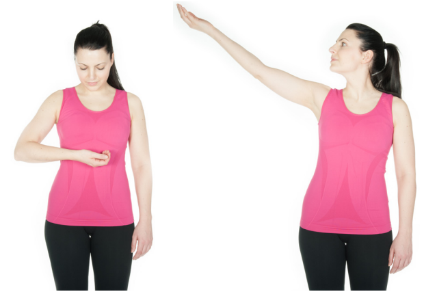
Vogel fliegen lassen