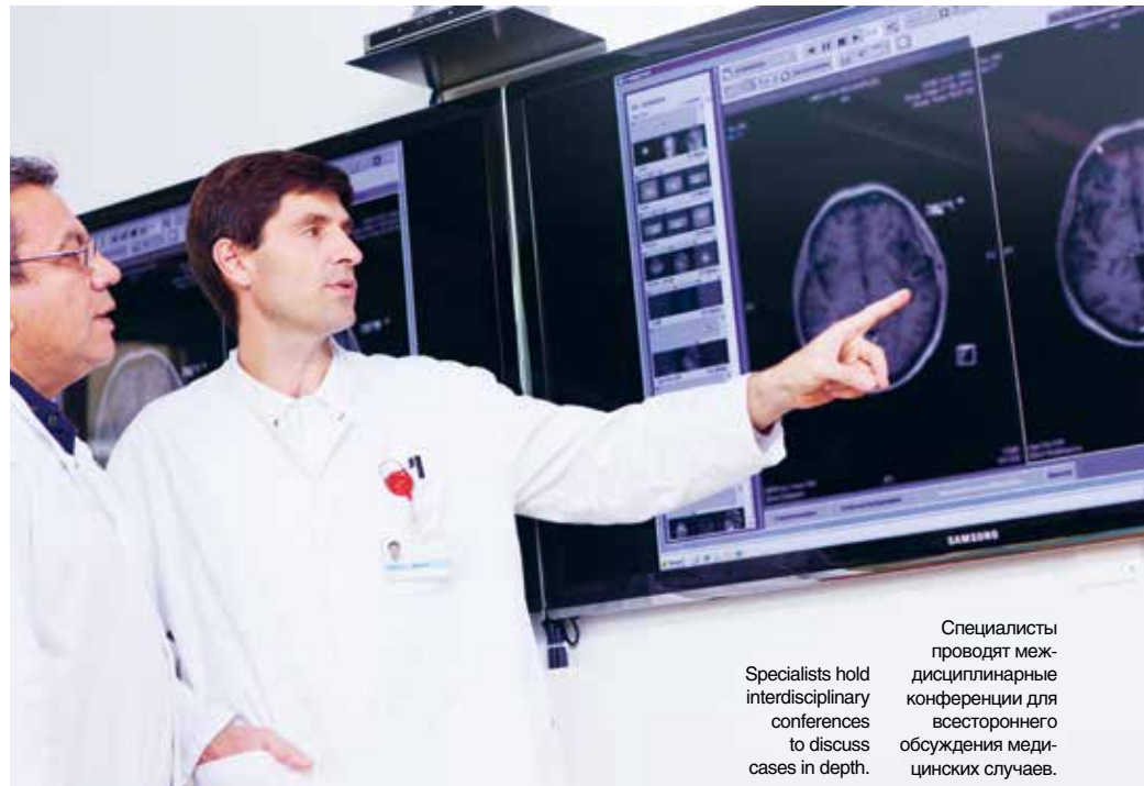
Specialists hold interdisciplinary conferences to discuss cases in depth. Специалисты проводят междисциплинарные конференции для всестороннего обсуждения медицинских случаев.

Техническая инфраструктура и самые современные и передовые междисциплинарные подходы гарантируют благополучие наших пациентов, что является сутью нашей деятельности. Как ведущая всемирно известная швейцарская университетская клиника, мы стремимся обеспечить наивысшие стандарты качества. Наши специалисты представляют полный спектр медицинских высокотехнологических услуг в более чем 50 клиниках. Международная команда врачей и высококвалифицированные медсестры заработали репутацию как в оказании основных медицинских услуг, так и в обеспечении инновационной терапии.