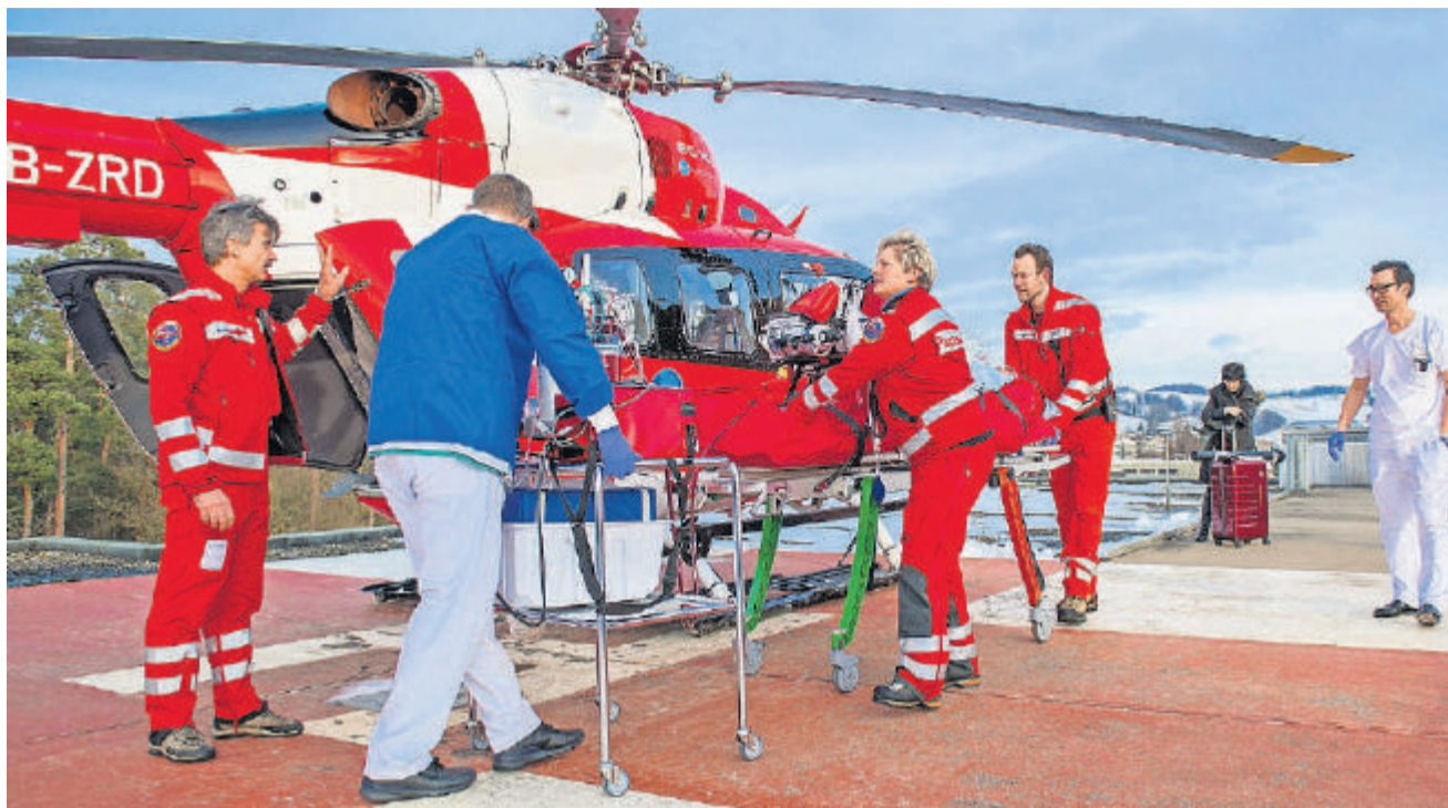
Soll die Sicherheitsvorschriften eines Flughafens erfüllen: der Helikopter-Landeplatz auf dem Unispital.

DIE BAZL-ANFORDERUNGEN ERFÜLLT der Helikopterlandeplatz heute nicht. Das beunruhigt auch die Basler Regierung. Sie hat in einer Stellungnahme an den Bund darauf hingewiesen, dass der Landeplatz des Unispitals «noch nicht nach