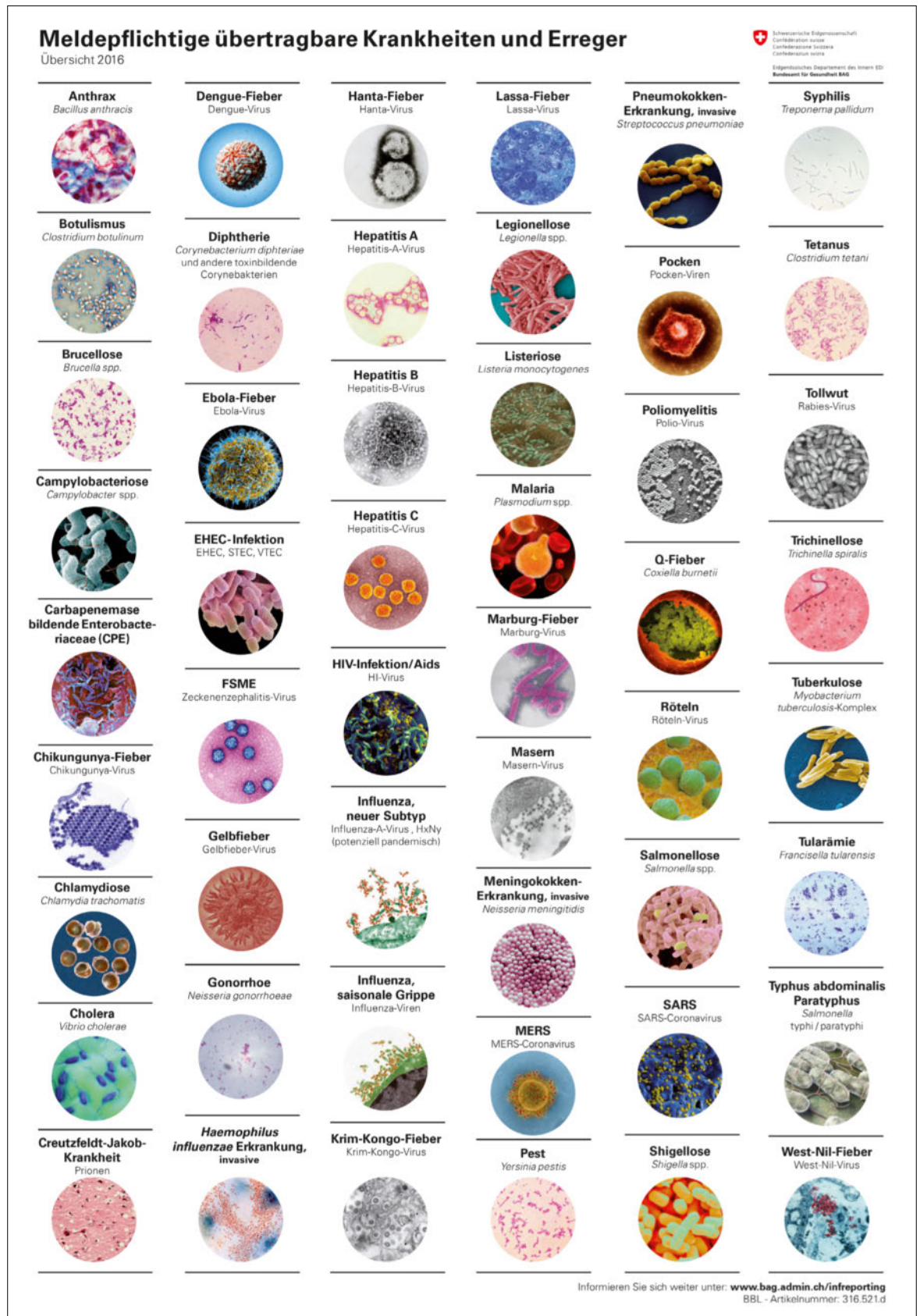
Abbildung 1: BAG-Poster «Meldepflichtige übertragbare Krankheiten und Erreger» in alphabetischer Reihenfolge (Zika fehlt noch) [27]. Nachdruck mit freundlicher Genehmigung des Bundesamtes für Gesundheit (BAG). Abrufbar unter: https://www.bag.admin.ch/bag/de/home/themen/mensch-gesundheit/uebertragbare-krankheiten/meldesysteme-infektions-krankheiten/meldepflichtige-ik.html .